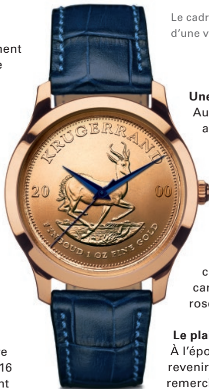
Le cadran du montre bracelet est doté d'une véritable pièce en or Krugerrand.

Ceux qui ont peu de temps à disposition doivent apprendre à le gérer. Par exemple, grâce à la montre bracelet du modèle Krugerrand, unique en son genre. Son cadran est doté d'une véritable pièce en or Krugerrand. Le poids en or de la montre est de 70 grammes, c'est-à-dire presque 2,5 onces d'or fin! Son boîtier, d'un diamètre de 38 mm est en or blanc, tout comme la couronne et la boucle ardillon. Le mouvement automatique suisse Sellita SW300 donne le rythme et dispose d'une réserve de marche de 42 heures. La montre pour homme Limited Edition Palladium 2016 f'est une autre création originale présentant f'une combinaison unique de matériaux, avec un mouvement à remontage manuel en palladium, un métal précieux rare. Il n'existe que 25 exemplaires de cette montre unique. Le boîtier, la couronne et la boucle ardillon de cette montre sont en palladium massif 950. Le mouvement à remontage manuel est bien visible grâce à un fond en verre saphir. Le bracelet alligator cousu main contraste agréablement avec le palladium et complète harmonieusement l'apparence générale de la montre.